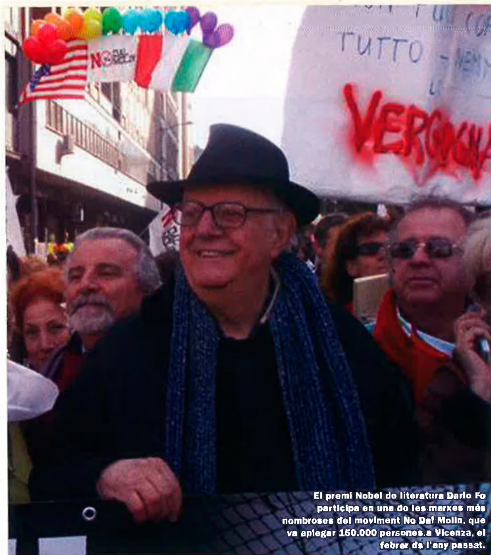
El premi Nobel de literatura Dario Fo participa en una de les marxes més nombroses del moviment No Dal Molin, que va aplegar 150.000 persones a Vicenza, el febrer de l'any passat.

taveu del moviment No Dal Molin, Francesco Pavin.