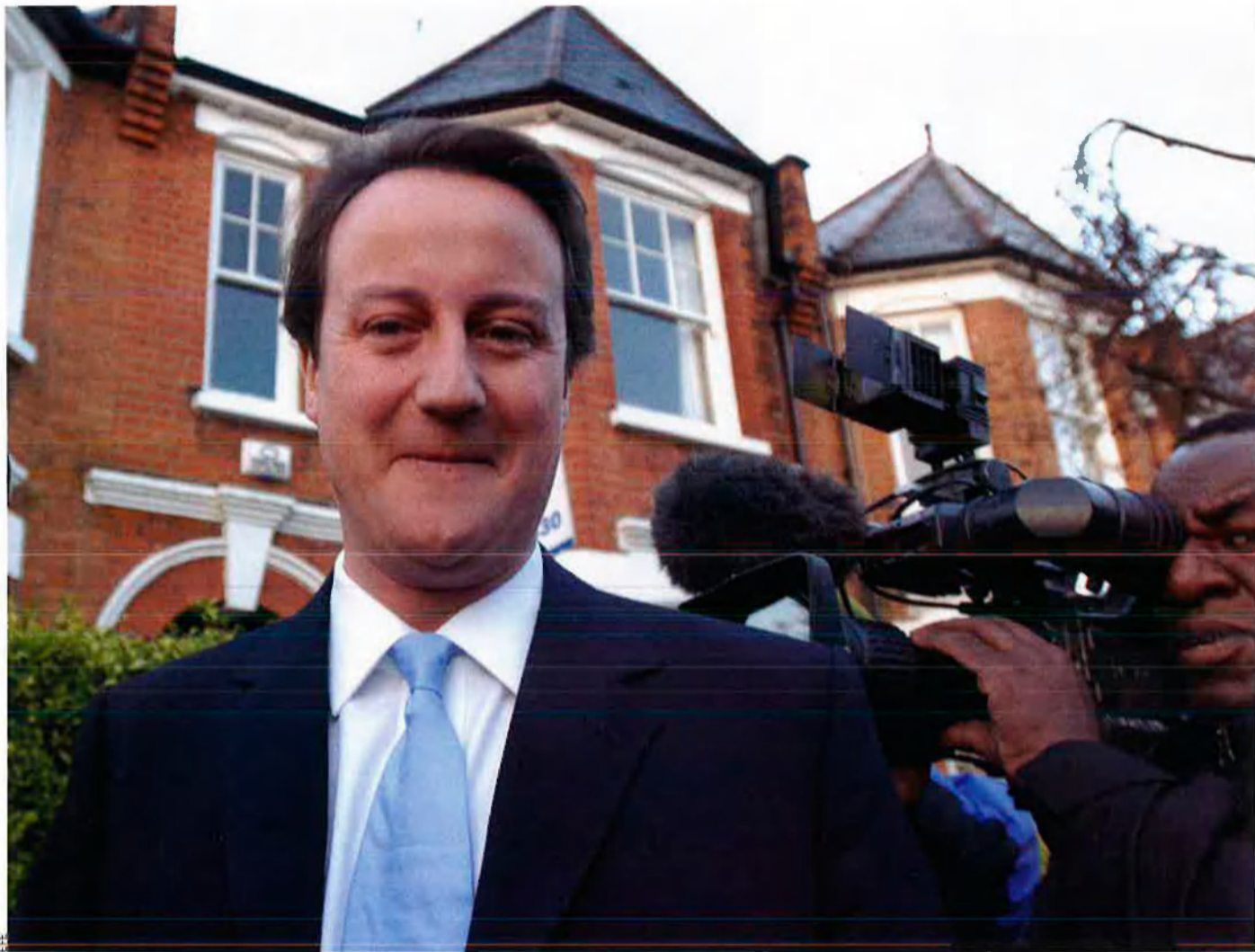
El líder del Partit Conservador britànic, David Cameron. Segons algunes prospeccions, avui el seu partit obtindria una victòria amb majoria absoluta.

rat. El 22,5 % dels electors ha canviat de partit. Si aquest humor s'haguera d'estendre a la geografia política de l'illa, el Partit Conservador obtindria una victòria absoluta, amb 236 diputats més que el Partit Laborista.