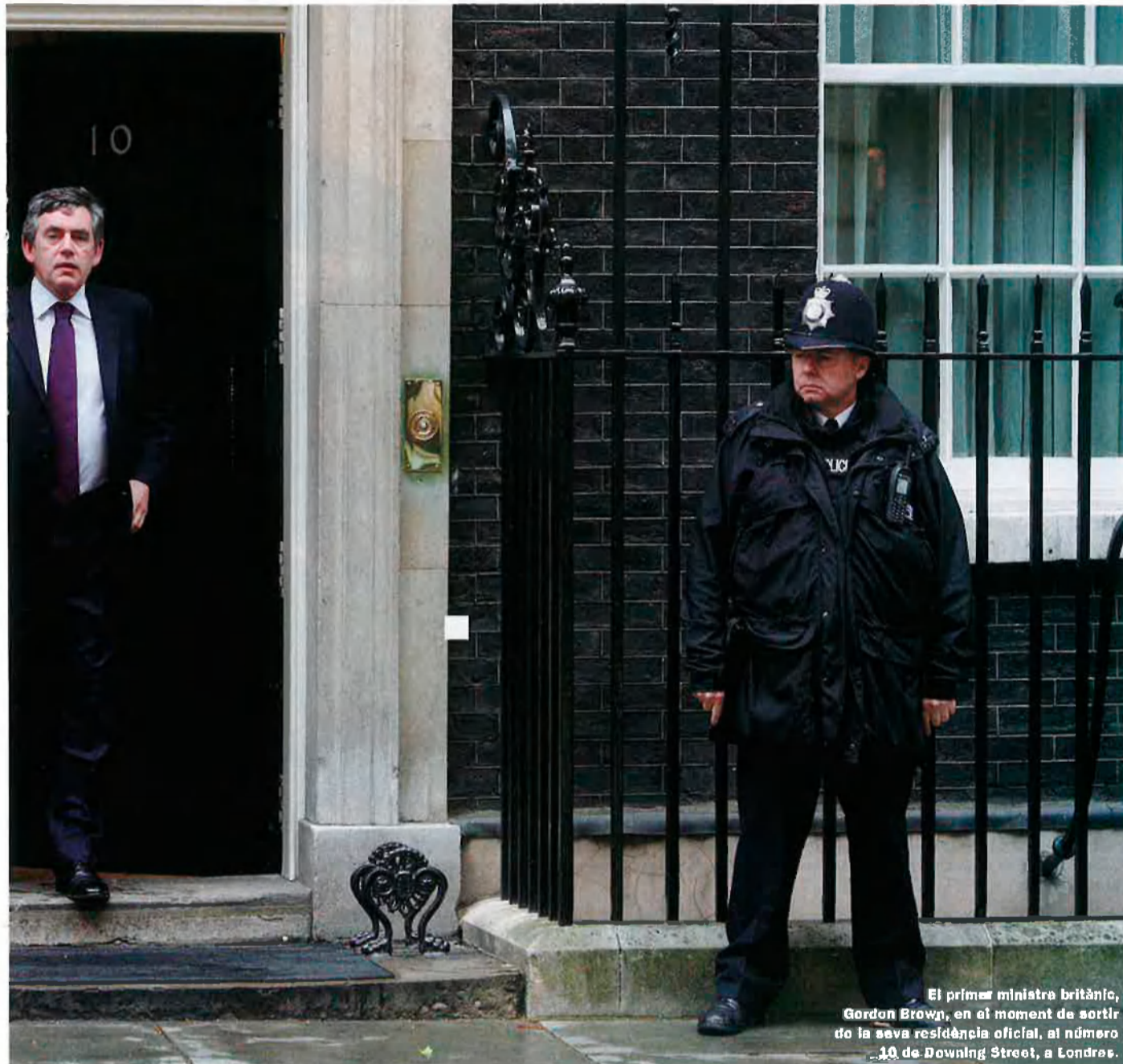
El primer ministre britànic, Gordon Brown, en el moment de sortir de la seva residència oficial, al número 10 de Downing Street, a Londres.