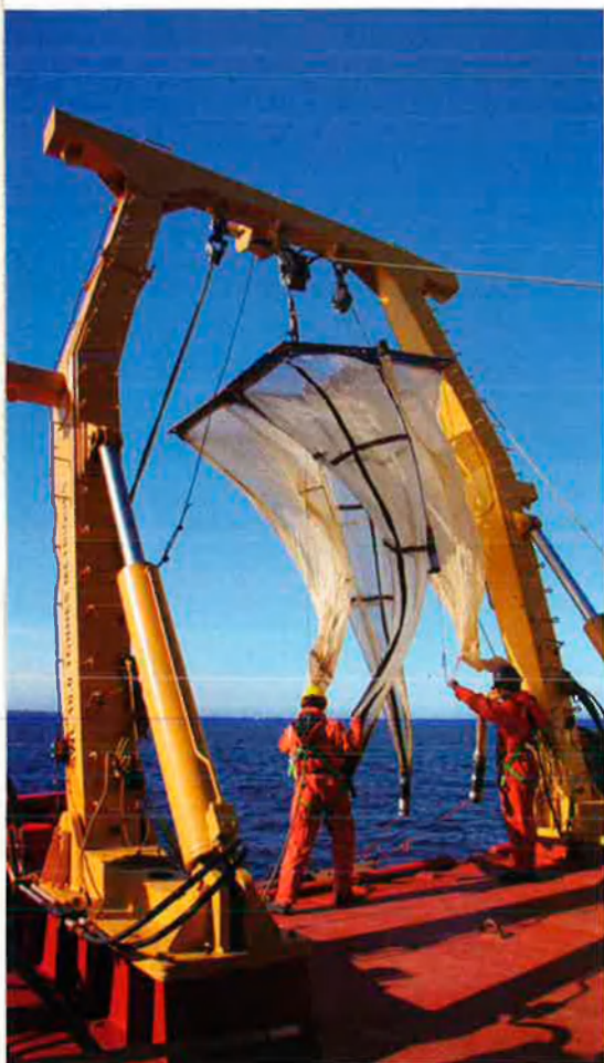
Científics a bord de l'Amundsen preparen les xarxes per agafar mostres de zooplàncton.

els carnívors ho fan a partir dels herbívors dels quals s'alimenten. El carboni de la matèria orgànica de tots aquests organismes torna a l'atmosfera en forma de \text{CO}_2 mitjançant la seva respiració i la seva descomposició un cop morts. Els ecosistemes aquàtics funcionen d'una manera semblant: el fitoplàncton, algues microscòpiques que floten a l'aigua, capta el \text{CO}_2 dissolt a l'aigua i a partir dels nutrients i de la llum solar fabrica la seva matèria orgànica, que s'incorpora a la resta d'organismes (zooplàncton —menuts animals que s'alimenten del fitoplàncton—, peixos, foques, óssos polars, balenes...) mitjançant la cadena alimentària. Quan aquests organismes moren, part d'ells s'enfonsa i queda al fons marí. De manera que en els ecosistemes aquàtics, a diferència dels terrestres, es produeix un flux de carboni des de l'atmosfera —en forma de \text{CO}_2 — fins al fons marí —en forma de matèria orgànica morta. És l'anomenada bomba biològica de carboni.