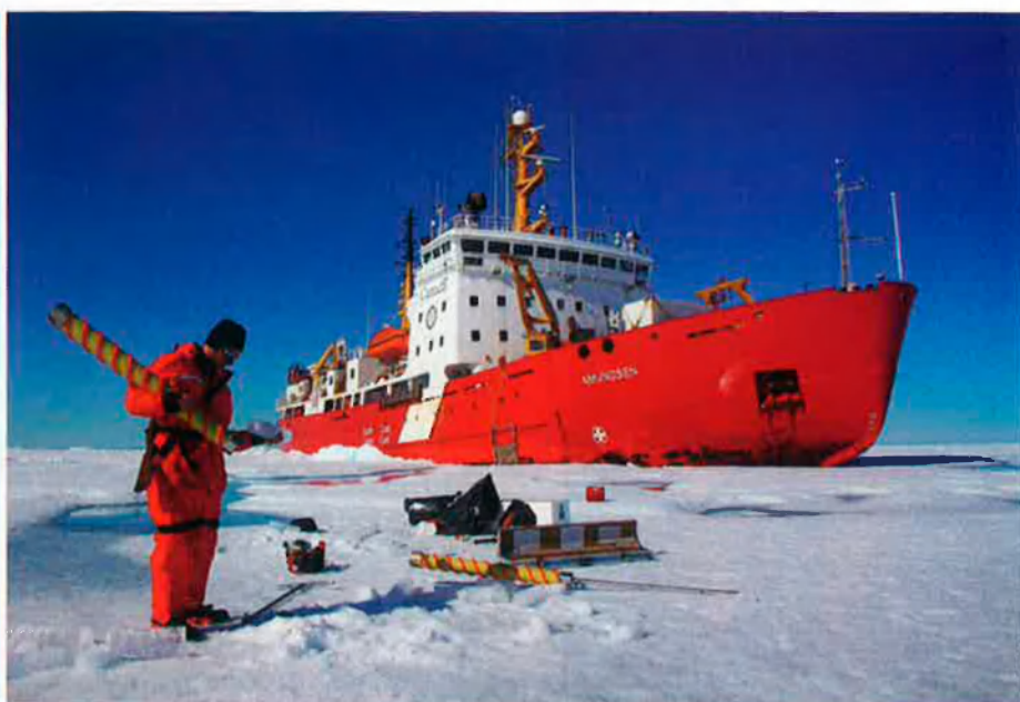
Científics de l'Amundsen perforen el gel per agafar mostres d'aigua. Un científic de l'Amundsen extreu una mostra cilíndrica de gel de la perforadora.

últimes tecnologies de recerca oceanogràfica i amb la capacitat d'acollir una cinquantena de científics. El 2003 aquest vaixell fou batejat amb el nom d'Amundsen en honor de l'explorador noruec Roald Amundsen, el primer a travessar la via que comunica, a través de l'arxipèlag canadenc, els oceans Atlàntic i Pacífic, més coneguda com a pas del nord-oest.