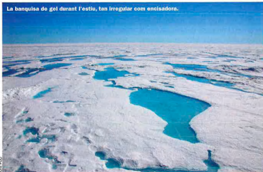
La banquisa de gel durant l'estiu, tan irregular com encisadora.