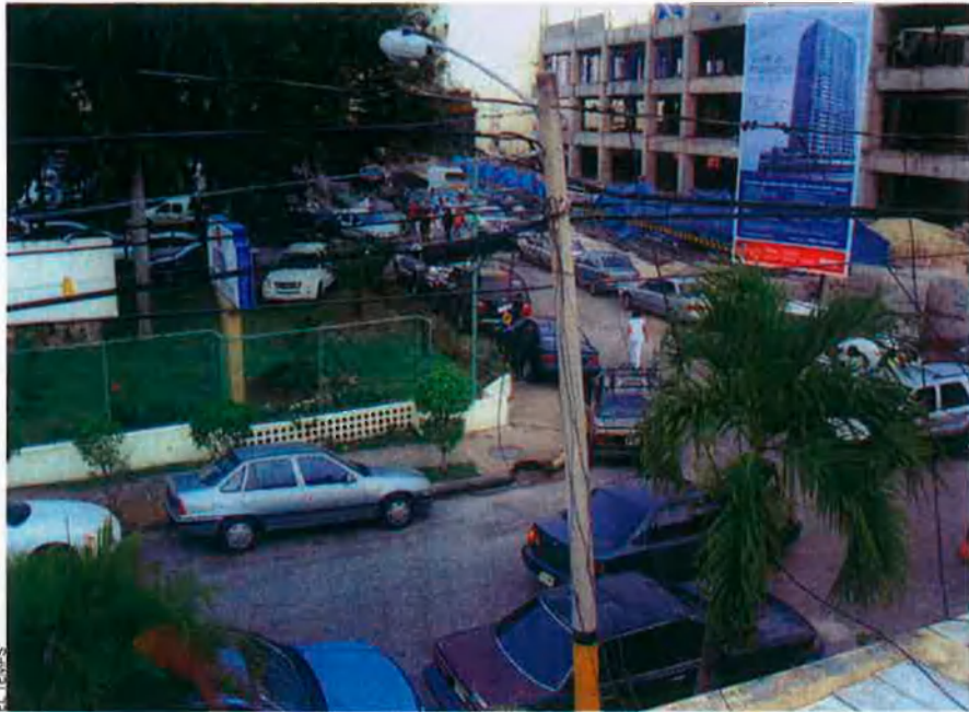
A dalt, Indret on s'ha començat a construir la Torre de la Plata (de 31 pisos), amb un cartell anunciador. A la dreta, retall d'un diari de la República Dominicana que es fa ressò del cas i, a sota, gràfic que mostra com serien les torres una vegada enllestides.