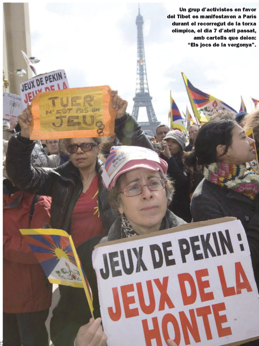
Un grup d'activistes en favor del Tibet es manifestaven a París durant el recorregut de la torxa olímpica, el dia 7 d'abril passat, amb cartells que deien: "Els jocs de la vergonya".

Les protestes arran del recorregut de la torxa olímpica, atacades per la repressió xinesa del poble tibetà, tornen a fer planar l'ombra del boicot sobre l'olimpisme. El 20 de juny és previst que la flama olímpica passi pel Tibet, cosa que els tibetans consideren una provocació.