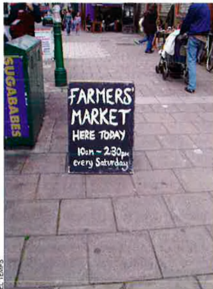
El dissabte hi ha un mercat dels grangers molt concorregut al barri de Lambeth, a Londres.

El primer ministre de Suècia, John Fredrik Reinfeldt, del Partit Liberal-conservador, ha declarat en nombroses ocasions que és favorable a l'abolició total dels subsidis i, sense dubte, farà valer la seua influència quan el país ocupe la presidència europea l'any vinent. I hi ha un altre bon motiu perquè les administracions francesa, espanyola i italiana capgiren la seua actitud actual: quan la incorporació dels nous membres a la Unió siga completa, passaran a ser contribuents en compte de receptors del suport financer. Llavors, cremar un 34% del pressupost general en un programa ineficax i no gaire just els deixarà un regust al paladar ben diferent. La publicació, el 30 d'abril del 2009, de la identitat de tots els receptors dels pagaments agraris i de desenvolupament rural, segons ordre