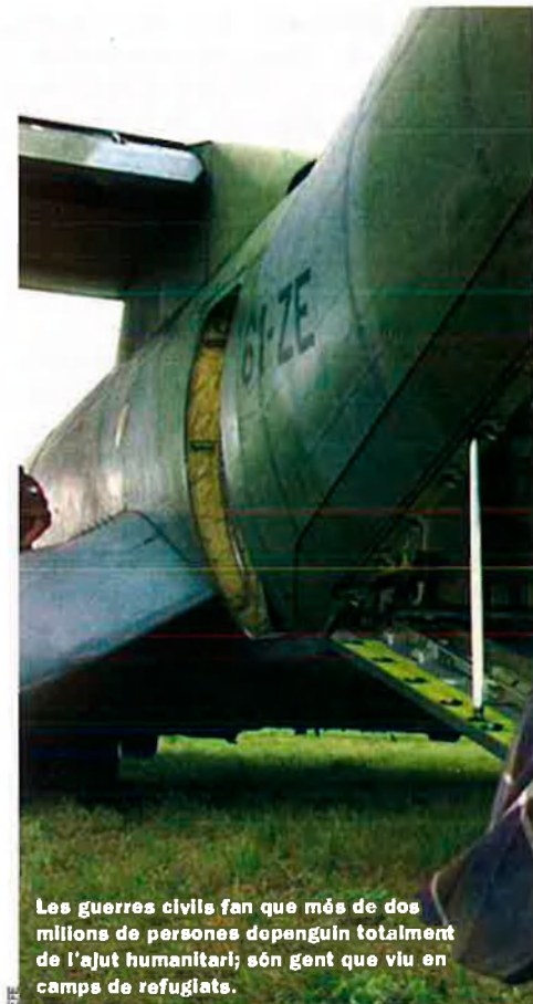
Les guerres civils fan que més de dos milions de persones depenguin totalment de l'ajut humanitari; són gent que viu en camps de refugiats.

Fins i tot a les zones riques, la fam s'ha convertit en un tema central, com per exemple a Dubayy. Allà els supermercats s'han compromès a mantenir els preus de vint aliments bàsics al-