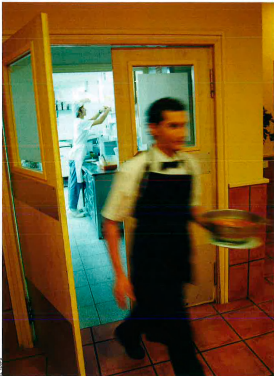
Si al segle XIX la crisi va fer que molts illencs emigrassin, ara hi arriben molts immigrants en cerca de feina; una bona part en troben a l'hostaleria.

les estructures que vertebraven una societat i un país. Tarabini confirma que “la realitat actual és definida per grups socials invisibles: desocupats de llarga durada sense estudis o amb poca formació; vells que tenen pensions mensuals de 500 euros o 600, o poc més; joves mileuristes , anant molt bé... És gent exclosa de la normalitat social. No interessen socialment ni políticament. I el grup social privilegiat encara no és capaç d'entendre el risc que implica aquesta situació”.