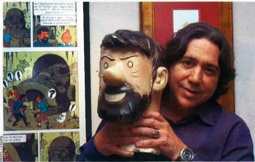
“Els hergeòlegs veiem molt clar que Hergé mai no va ser feixista, ni de dretes.”