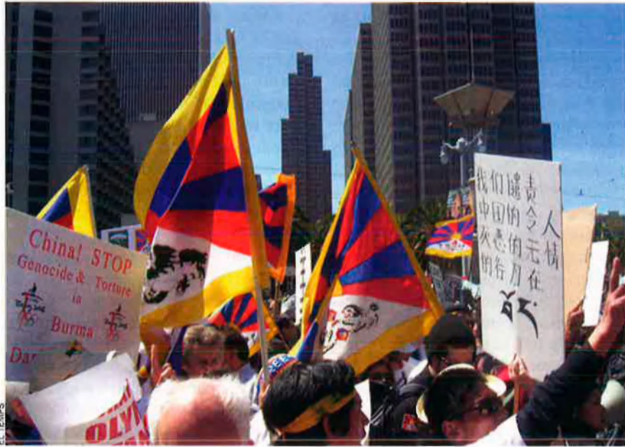
Les manifestacions de solidaritat amb el Tibet i contra la repressió que hi exerceix la Xina han augmentat molt en ocasió dels Jocs Olímpics.

quals afecten 1.300 milions de persones, es troben en una cruïlla. Espere que escullen una política fonamentalment nova, una política realista.