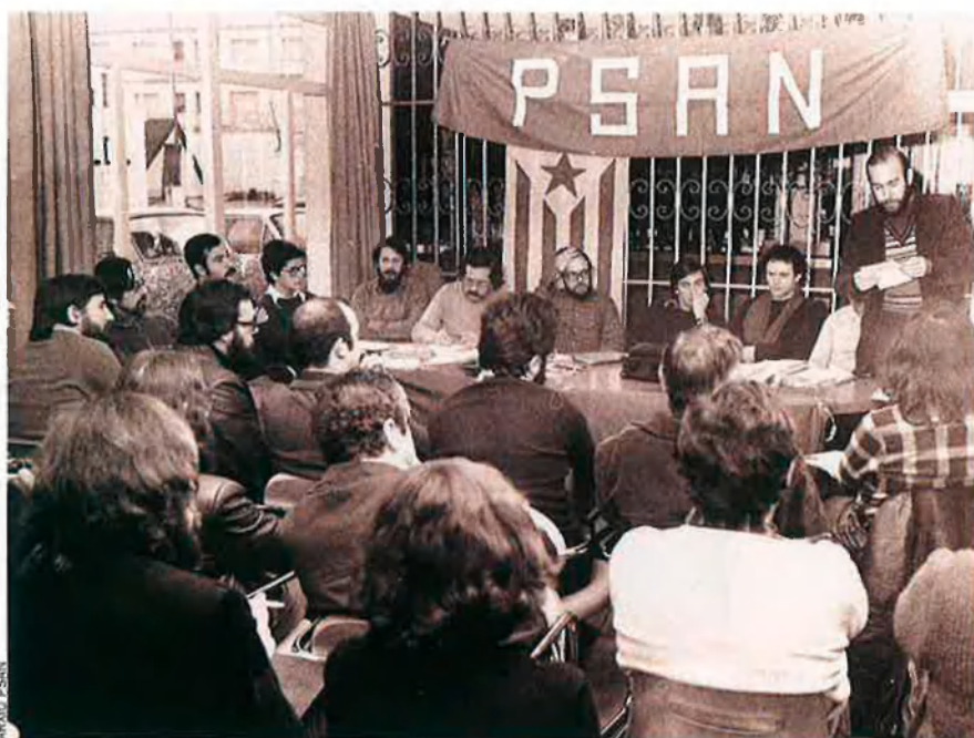
Els joves escindits del Front Nacional de Catalunya fan la revolució política i cultural, el mateix any que els estudiants francesos. Funden el Partit Socialista d'Alliberament Nacional dels Països Catalans i creen una estratègia nova.

A la universitat, d'un curs per l'altre, els estudiants treuen pit i es neguen a