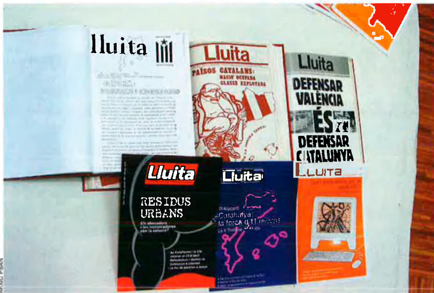
Són anys d'efervescència política. El PSAN afirma que una nació oprimida té el dret de fer servir totes les formes de lluita per a mitjà del seu alliberament. La Universitat Catalana d'Estiu, nascuda el 69 a iniciativa de la gent del Rosselló, reforçarà la consciència de Països Catalans.