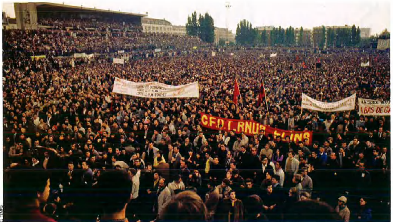
Es tendeix a oblidar que una vaga general de més de deu milions de treballadors va paraitzar el país durant gairebé un mes.

del surrealisme. Cohn-Bendit i els seus amics, de manera conscient o no, van ser la imatge d'una erupció revolucionària que, diuen, va canviar el món.