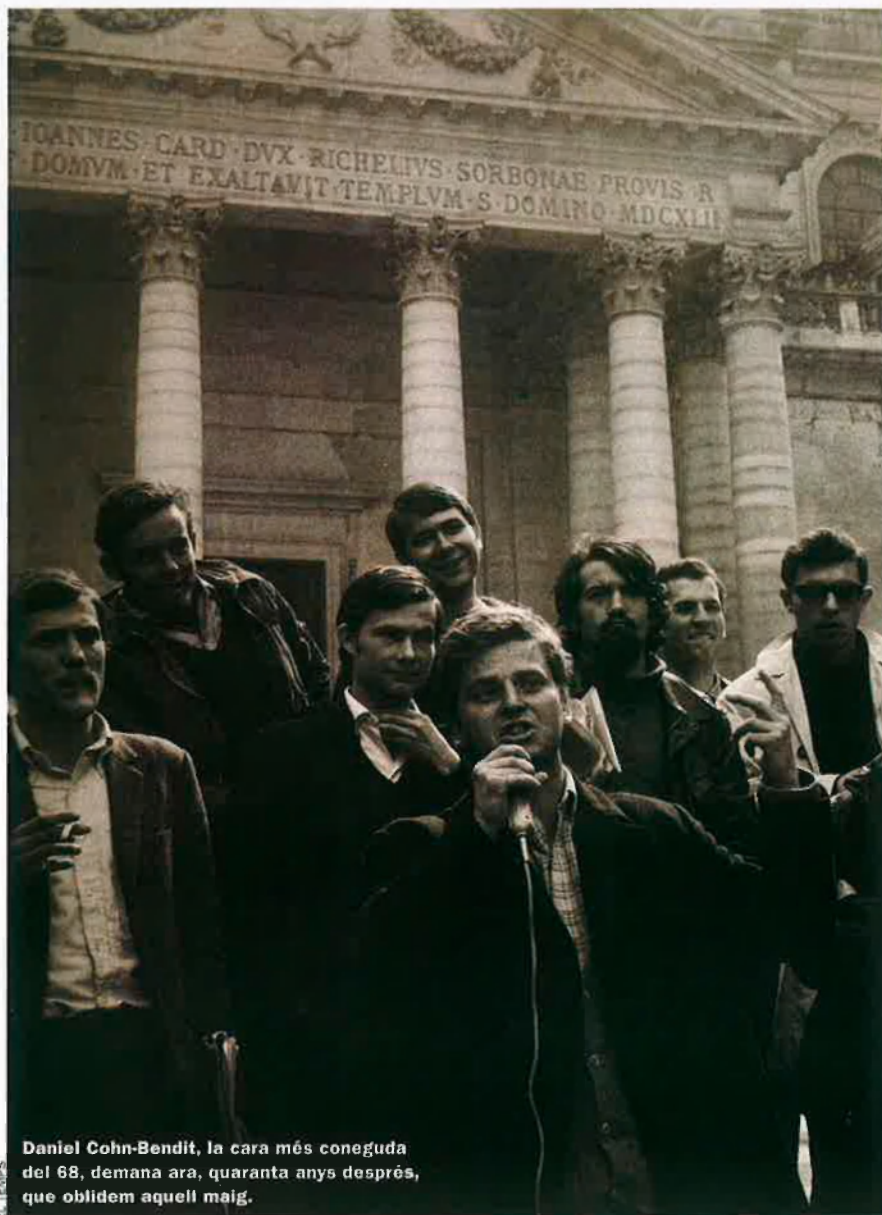
Daniel Cohn-Bendit, la cara més coneguda del 68, demana ara, quaranta anys després, que oblidem aquell maig.

El maig del 68 va mobilitzar pacifistes anticonsumistes i radicals disposats a la lluita armada. El Partit Comunista Francès no va voler saber-ne res i la mateixa l’URSS preferí mantenir l’equilibri de blocs que una França revolucionària.