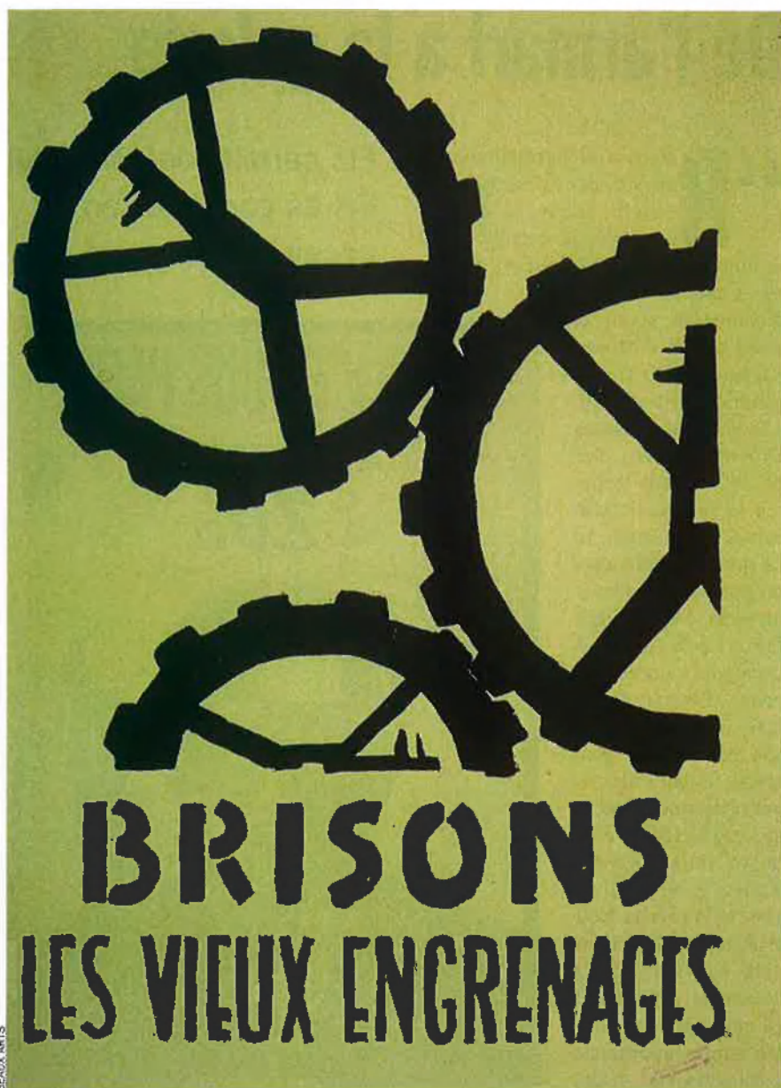
“Trenquem els vells engranatges”.

El gran equívoc és que, durant el mes de maig, els nois que es manifestaren i ocuparen el carrer ho feren en nom de Mao, Marx o Bakunin, però la “nova societat” del futur primer ministre Jacques Chaban-Delmas i del president Pompidou serà més liberal i gens maoïsta, marxista o anarquista. I l'equívoc es produïa en el si dels mateixos líders revolucionaris, que veien, per exemple, la Revolució cultural xinesa com una forma de lluita contra la burocratització dels partits comunistes, com una rebel·lió de la base contra la direcció; que veien el marxisme i el leninisme com la mateixa cosa i creien que a l'URSS tot es va espantllar a partir del moment en què Stalin va començar a manar; que veien l'anarquisme com la dissolució de tota forma d'organització jerarquitzada. La realitat és que el PCF —i el seu sindicat, la CGT— no van voler saber res del Maig del 68 —en parlaven com d'una “amença de guerra civil”, en un document oficial— perquè a l'URSS no volien debilitar