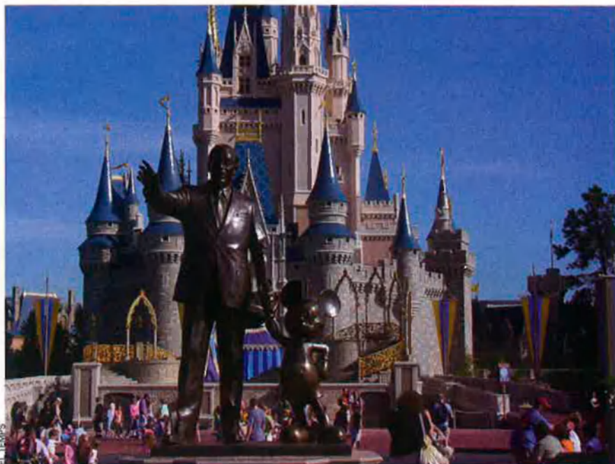
Dalt, Walt Disney i la seua cració més famosa, Mickey Mouse a l'entrada de Disney World. Baix, fotogrames de 'Steamboat Willie', el primer curtmetratge on va aparèixer Mickey.

Mickey, símbol del pop-art. Igual que l'ampolla de Coca-Cola, la figura de Mickey Mouse ha esdevingut, amb el pas del temps, un dels símbols del Made in America , exemplificat en aquest parell de grans orelles esfèriques. Amb aquest pes icònic, no