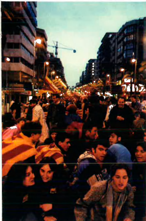
Una imatge de la manifestació del 1995 amb el lema "Alacant és important".

"Alacant és la nostra capital del sud, però és també més que una ciutat valenciana: té la missió d'articular una part important del territori del nostre país, i de mantenir-lo unit. No és tolerable que alguns, per interessos bastards i poc confessables, vulguen convertir aquesta ciutat i aquestes comarques en alguna cosa diferent del que són per història, per identitat nacional i per consciència i voluntat del mateix poble".