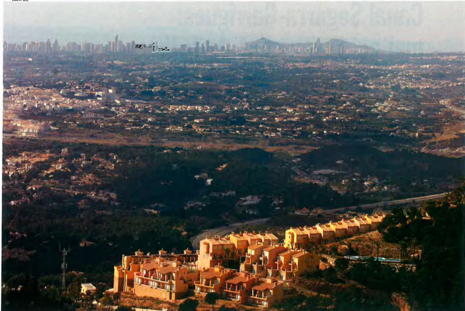
Altea, a Marina Baixa, és un dels millor exemples de l'extensió del ciment sobre el nostre territori.

en el cas de Catalunya, i als Ports, al País Valencià. Per una altra banda, “no podem oblidar”, apunta el monogràfic, “la disminució o desaparició d’algunes zones humides i aiguamolls encara sense construir al litoral”, a més de “la destrucció d’hortes i altres paisatges culturals de gran valor ecològic i social”.