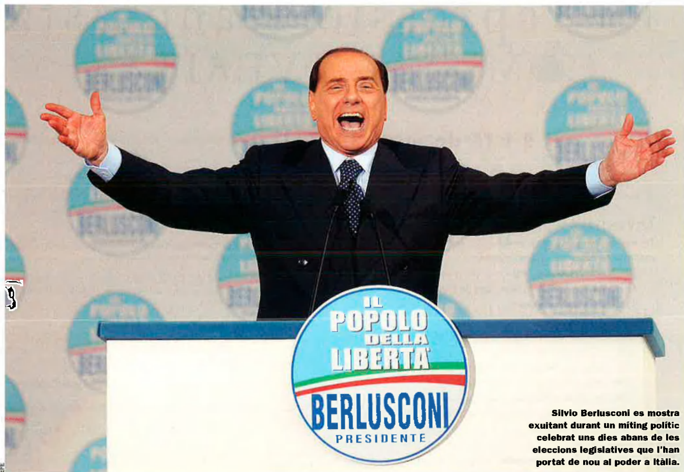
Silvio Berlusconi es mostra exultant durant un miting polític celebrat uns dies abans de les eleccions legislatives que l'han portat de nou al poder a Itàlia.