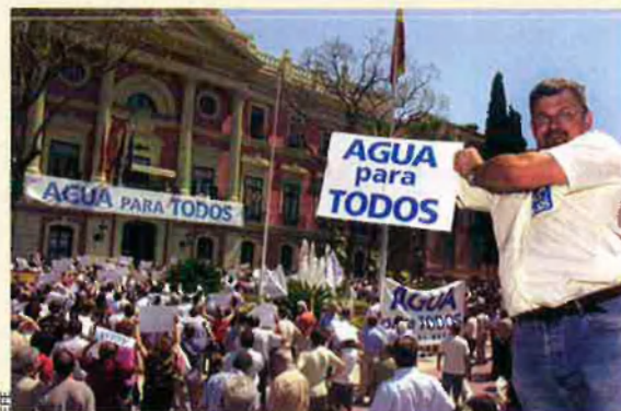
A l'Ajuntament de Múrcia penja sempre la pancarta proaigua.