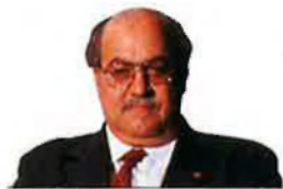
Andreu Mas- Colell