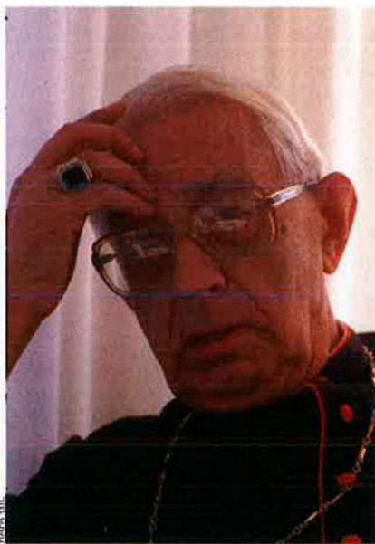
Borriana ha dedicat un llibre a Vicent Enrique i Tarancón.