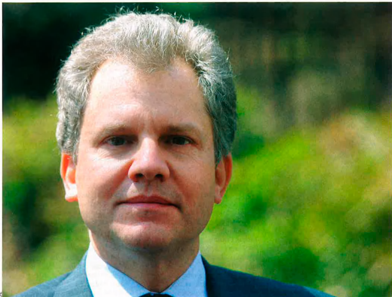
Arthur Ochs Sulzberger

fosc. Amb les dues mans brandava una espasa, disposat a usar-la.