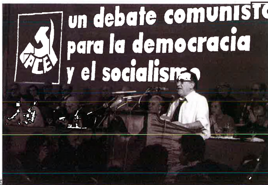
Al IX congrés, el PCE va abandonar definitivament el leninisme i va abraçar la reforma.

Les eleccions espanyoles del 9 de març han posat en evidència la dificultat que tenen, com a la resta de l'Europa occidental, les formacions comunistes i les hereves dels partits comunistes tradicionals. Unes dificultats que ja fa temps que han anat engegant processos de redefinició i reformulació política que han acabat bastint projectes que pràcticament han bandejat els elements clàssics del comunisme.