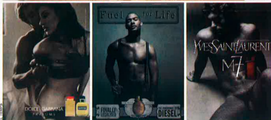
A llarg dels anys, la publicitat de perfums ha deixat imatges molt variades, sempre jugant amb la sensualitat, per bé que a vegades ha fregat el mal gust.

ara en l'últim perfum de Paco Rabanne, Black XS.