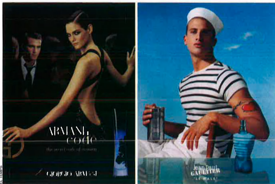
L'ús de la imatge de l'home i de la dona ha estat la base de la publicitat de perfums, tot i que s'ha diversificat amb el temps. Avui s'imposa l'estètica gal en la imatge masculina.

La publicitat dels perfums conté una càrrega eròtica, com més va més audaç i provocadora.