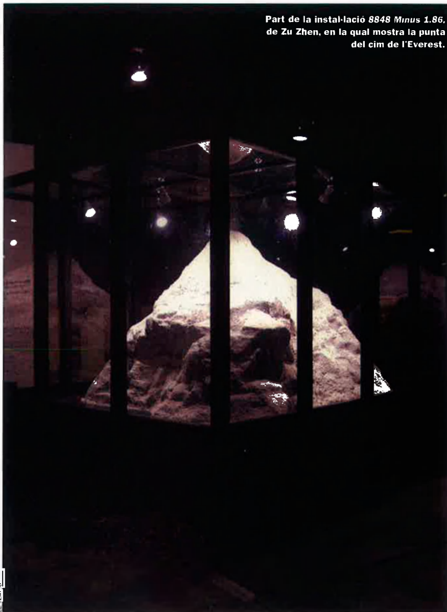
Part de la instal·lació 8848 Minus 1.86 , de Zu Zhen, en la qual mostra la punta del cim de l'Everest.

No oblidem la gran contradicció xinesa: es tracta d'un règim comunista que provocà la revolució cultural , l'eliminació de qualsevol resta del passat imperial, que mobilitzà masses vers el camp, a ritme de consigna. Després començà a alliberar l'economia de tal manera que aviat fou la primera potència econòmica mundial. El liberalisme més acarnissat, conduït pel Partit Comunista més poderós del món. I, malgrat tot, la vida privada i l'art gaudeixen d'una llibertat increïble mentre no ataquen els