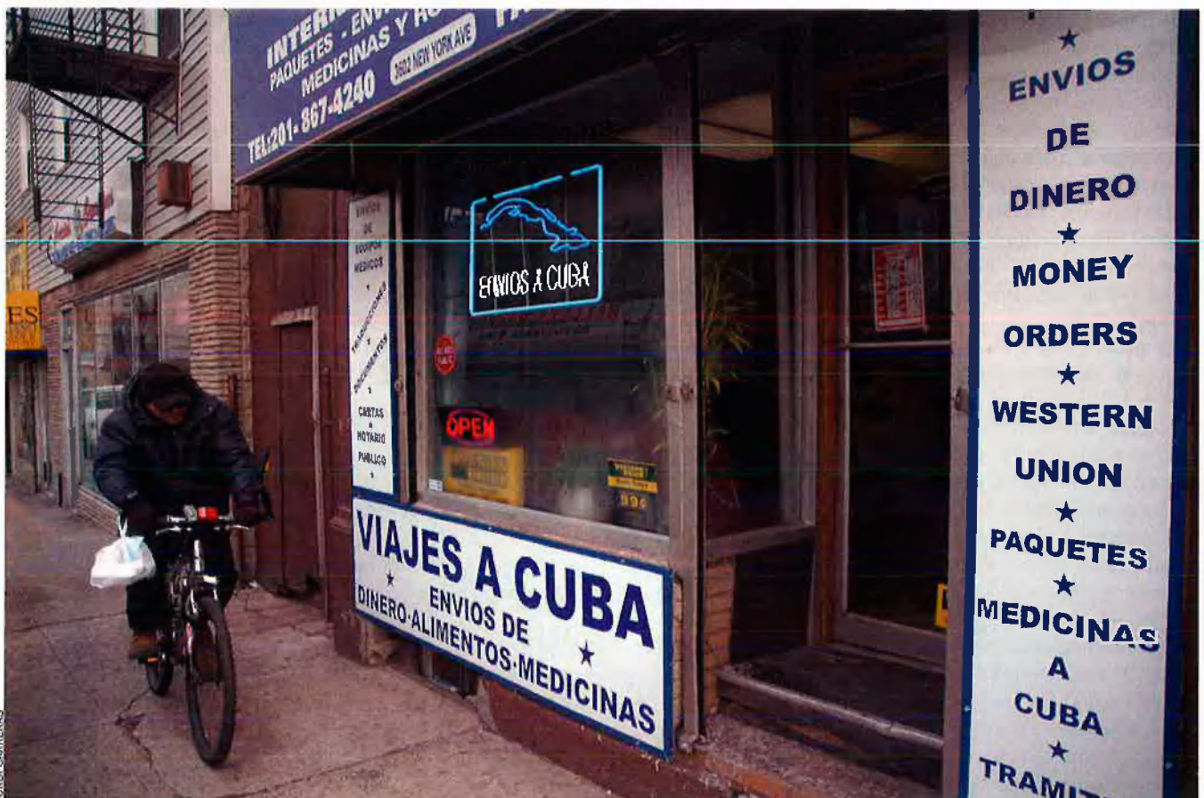
Un home amb bicicleta passa pel davant d'un establiment especialitzat en trameses de diners i paquets a Cuba, en un carrer de Nova Jersey.