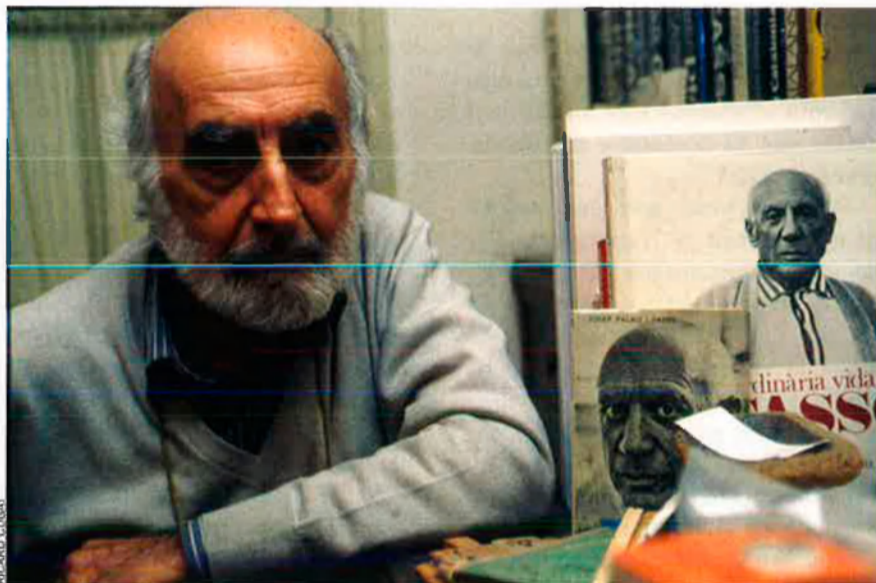
La gran passió de Josep Palau i Fabre va ser l'estudi de l'obra de Pablo Picasso. El resultat, una extensa bibliografia traduïda a més d'una dotzena de llengües.

El reconeixement oficial i la projecció pública li van arribar els darrers anys de la seva vida. Josep Palau i Fabre, mort el 23 de febrer passat, va ser un marginat condemnat al silenci, fins passada la setantena d'anys.