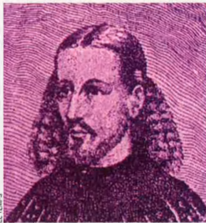
Ausiàs Marc, mort ara fa 549 anys, fou el poeta català més universal.

El 3 de març del 1459 va entonar el cant més definitiu, el darrer. Fa 549 anys que va morir el nostre més gegant i més subtil, el més genial i universal poeta. A sa casa del carrer de les Avellanes, "detingut d'accident de malaltia", el 29 d'octubre del 1458 va testar, "estant en mon bon seny, memòria sencera e loquela manifesta faç e orden lo presente meu darrer testament e la mia darrera volentat". Elegix sepultura "en lo cementerí de la Seu de València, en la capella o vas dels Marchs, construïda en la claustra, prop de la casa del capítol". Potser, en un punt diferent de la catedral, una lauda, posada el 1950, recorda les despulles de l'hoste més distingit, vorejada amb uns versos contundents; com que no pot estimar, desitja la mort, amb vehemència demana a Déu que no li allargue més la vida: "Jo só aquest qui en la mort delit prenc,/ puix que no tolca la causa per què em ve."