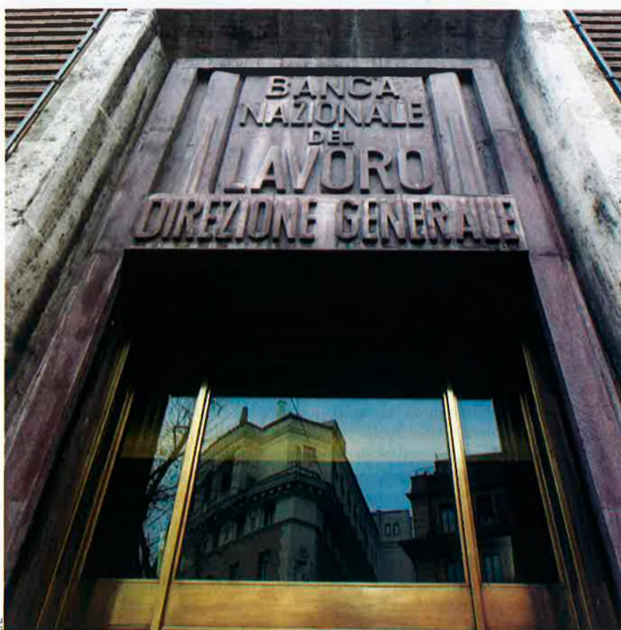
Banca Nazionale del Lavoro, un dels bancs més importants d'Itàlia. En aquell país, una llei del 1990 va transformar les caixes d'estalvis en societats cotitzades.

El mirall italià per a la banca espanyola. La transformació en societat anònima per part de les entitats financeres que exercien l'activitat creditícia com a fundacions públiques va fer possible que moltes d'aquestes entitats s'integressin en el balanç dels bancs als quals eren adscrites, i va facilitar la fusió entre les que pertanyien al mateix grup bancari. I això fins al punt que, del 1990 fins el 2007,