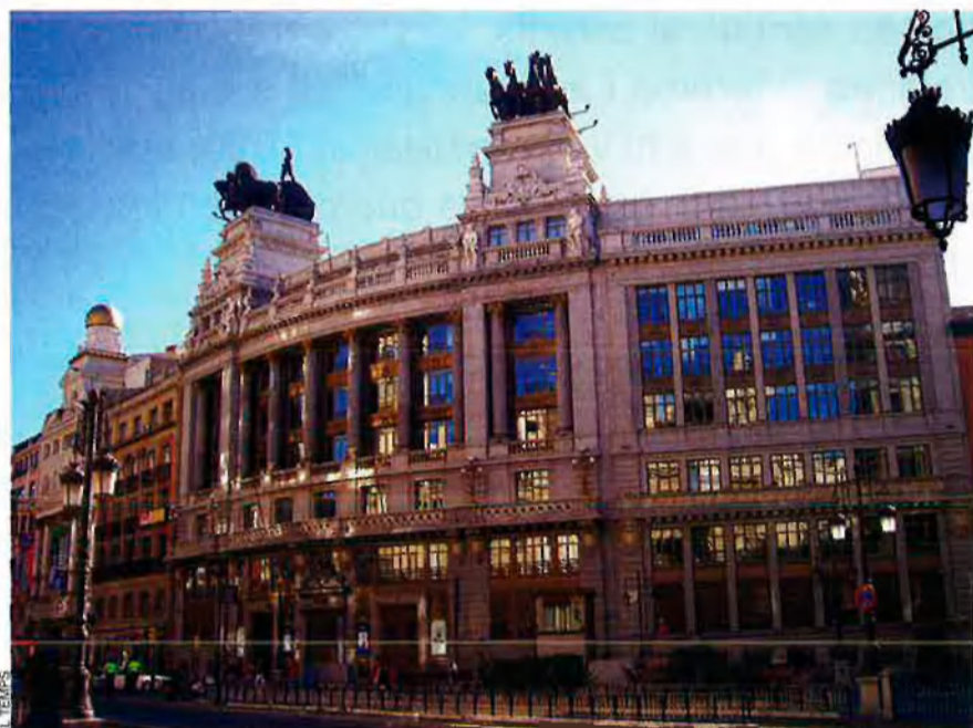
Seu central del BBVA. A l'estat espanyol, la banca denuncia competència deslleial per part de les caixes d'estalvis, per "privilegis fiscals" i per un alt grau de "proteccionisme legal".

ries en el capital d'unes altres empreses bancàries i financeres. En aquest cas, la principal font de finançament són els dividendes que reben de la banca en què participen, una part dels quals van a la dotació dels fons de reserves per a garantir la capacitat de la fundació de mantenir el control de la societat bancària; i la resta es destinen al finançament d'obres socials.