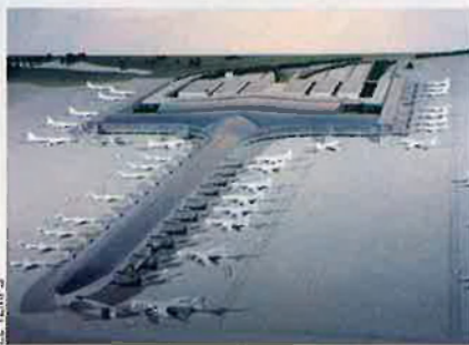
La T-Sud suscità l'interès de moltes companyies. Iberia se'n va endur un bon pessic.