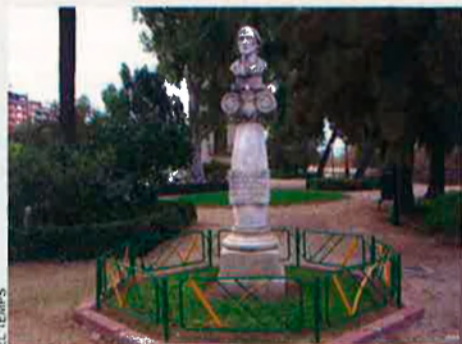
Estàtua de Lluís de Santàngel a l'Albereda de València.

Fou el 18 de febrer del 1493, en una alta mar calmada, en tornar del seu viatge a l'altra carena de la mar de les