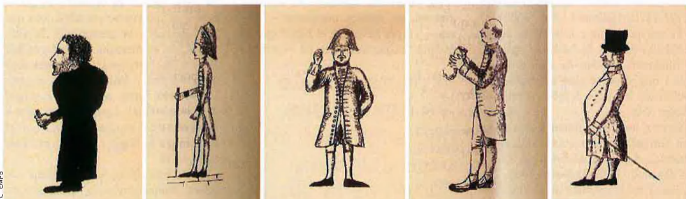
A la còpia de La Musa Vigatana que es conserva a la Biblioteca Episcopal de Vic i que reproduceix l'original perdut, hi apareixen dibuixats un sagristà geperut i quatre frares jerònims que, despullats de l'hàbit pels invasors francesos, van haver de vestir-se de civils, tots ells objecte de poemes.