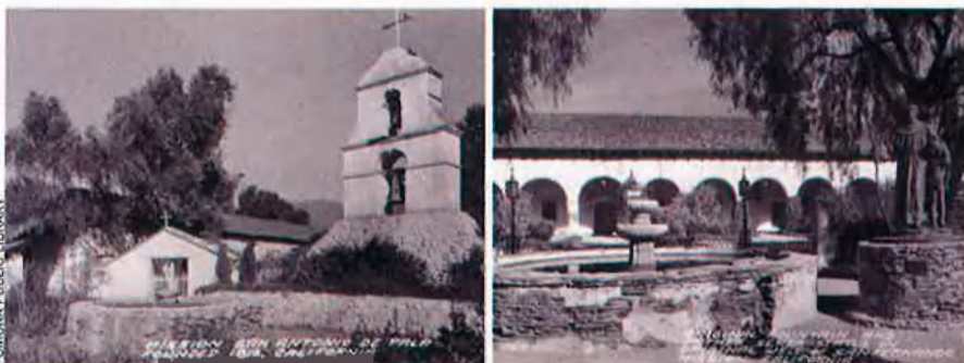
POMONA PUBLIC LIBRARY