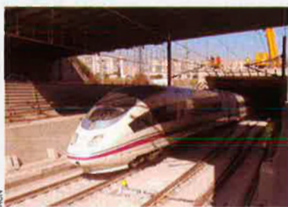
L'alta velocitat acumula gairebé quatre anys de retard i una forta polèmica pel seu traçat.

Havia d'arribar a Barcelona el 2004 sota mandat del PP, nou anys després d'haver-ne posat la primera pedra. Finalment, hi arribarà el 20 de febrer, un dia abans de començar la campanya electoral, portat per la ministra que més ha menyspreat Catalunya, Magdalena Álvarez. La ministra va aterrar a Barcelona la setmana passada i es va limitar a demanar disculpes pel retard i les molèsties causades per les obres, entenen per molèsties les contínues avaries a la xarxa de rodalia i un esvoranc al Gornal que va obligar a tallar fins i tot el trànsit dels Ferrocarrils de la