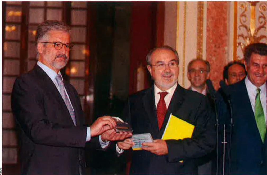
El ministre Pedro Solbes va quadrar uns pressupostos de l'estat per al 2008 que no satisfan ni de bon tros les necessitats d'inversió de Catalunya, que té un dèficit fiscal del 10,2% del seu PIB.

L'espoli silenciós a les illes. Pel que fa a les illes Balears, la situació d'espoli va més enllà encara que a