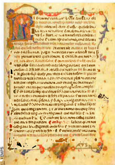
Jaume I compara sense gens de por per Aragó i Catalunya.