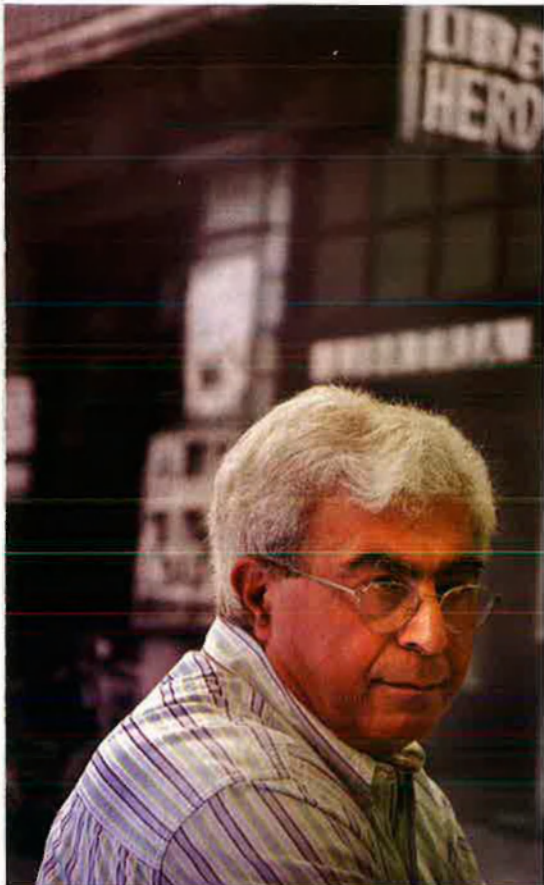
Elias Khoury ha visitat Barcelona arran de l'edició catalana de La cova del sol .

catombes i matances a pobles. També hi ha moltes històries que vaig recollir, però que no he fet servir. Sigui com sigui, gràcies a tots aquests testimonis vaig descobrir la música de la llengua parlada i vaig poder entrar en profunditat en aquest patiment.