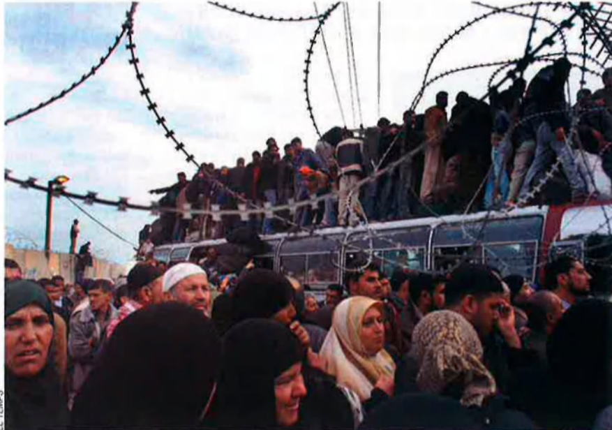
"No crec que hi haja cap crisi humanitària a Gaza. El govern local de Hamàs manipula la informació per a crear la impressió d'una crisi"

— Això significa que es poden continuar edificant colònies al Jerusalem oriental. No vau demanar el 2002, juntament amb l'intel·lectual palestí Sari Nusseiba, la divisió de Jerusalem?