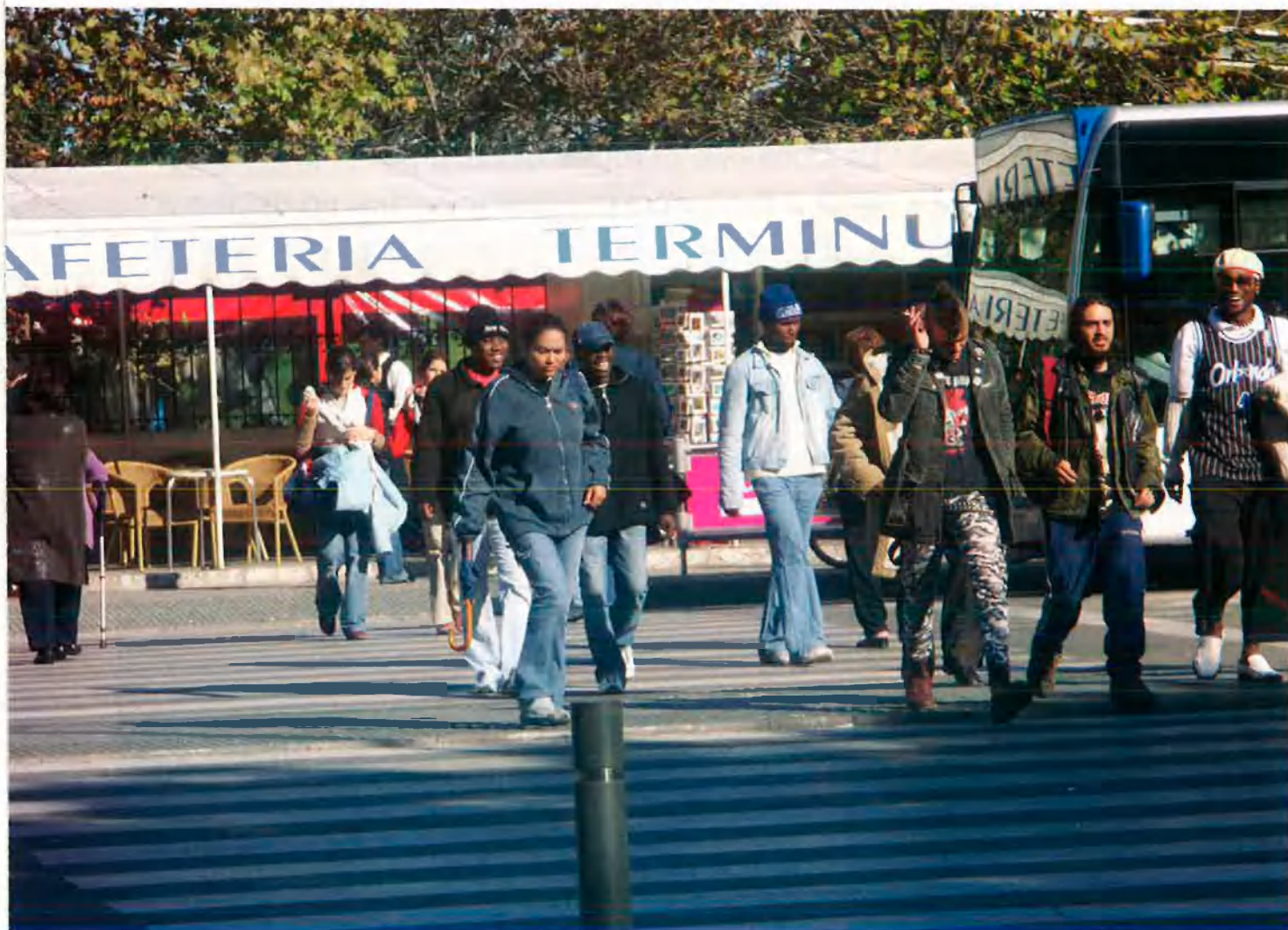
El 35% de la població dels Països Catalans és immigrada.