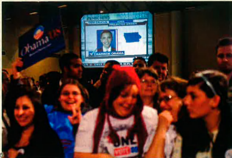
Uns seguidors del senador Barack Obama, aspirant a la candidatura a la presidència dels Estats Units pel Partit Demòcrata, celebren la seva victòria a les primàries d'Iowa, a Des Moines, el dia 3 de gener.

La virtut és que, gràcies a la mida d'Iowa i Nou Hampshire, i a la seriositat amb que