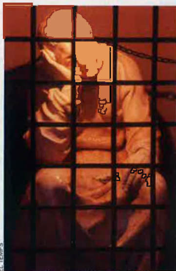
Capella de Sant Vicent Màrtir, que reproduïx la presó on fou tancat.

Jaume I, portat d'un gran olfacte polític, atribuï el martiri