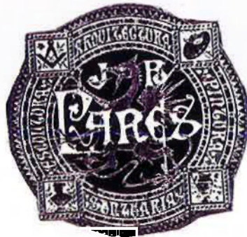
Primer segell de la Sala Parés, del 1884, amb símbols francmaçònics.