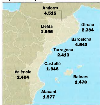
Preu mitjà del m 2 construït a les capitals de província

Les estadístiques mostren, de fet, que aquesta darrera dècada, els Països Catalans han estirat els preus de l'habitatge per damunt de la mitjana estatal i que, avui dia, continuen encapçalant la taula d'incrementos. Els Països Catalans es col·locaren a la locomotora del tren de l'habitatge i, si més no de moment, no semblen canviar de vagó. Així doncs, si l'increment anual del preu de l'habitatge va ser de 5,1%, a l'estat espanyol, al Principat, el País Valencià i les Balears fou de 8,3%, 7,9% i 4,6%, respectivament; els dos primers són els territoris líders pel que fa a la puja de preu de l'habitatge. Les dades referides al segon semestre de l'any passat, quan la crisi de confiança desfermada al mercat financer havia contagiado el mercat de l'habitatge, van en la mateixa direcció: si l'augment a l'estat espanyol fou de l'1,1%, al Principat i al País Valencià fou del 2% i a les Balears de l'1,5%.