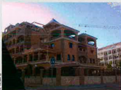
Caixa Catalunya preveu un creixement del PIB del 2,8%, un punt menys que el 2007.

“De cap manera no ens trobem en una situació de crisi ni de recessió; encara més, dins la dificultat, l'economia europea està en un bon moment”, assegura Josep Oliver, catedràtic d'economia aplicada de la UAB i responsable de l'informe semestral de perspectives de Caixa Catalunya. Les previsions de l'entitat financera assenyalen un creixement de l'economia catalana el 2008 del 2,8%, mentre que el 2007 s'ha tancat amb un creixement del 3,8%. Enguany, es crearan uns 65.000 llocs de treball, que poden compensar els efectes en el mercat de treball de la desacceleració de la construcció. El consum privat se situarà entorn del 3%.