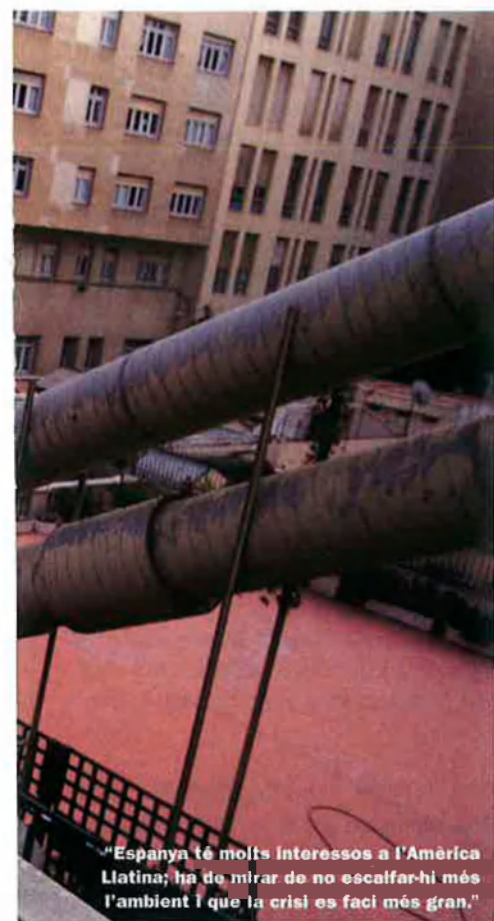
"Espanya té molts interessos a l'Amèrica Llatina; ha de mirar de no escalfar-hi més l'ambient i que la crisi es faci més gran."

cada, entre més coses perquè Espanya té un greu problema de política exterior. Un país no es pot permetre de no tenir consens en política exterior. El fet que el PP critiqui constantment la política exterior de Zapatero no és bo, perquè debilita la posició d'Espanya a l'estranger. L'Aliança de Civilitzacions pot ser considerada, si es vol, ingènua, però de fet és una idea que ja havia expressat Aznar quan parlava de diàleg entre civilitzacions. Crec que és una proposta molt ambiciosa, però en un temps en què ha predominat l'unilateralisme és una iniciativa que cal tenir en compte, sobretot perquè es fa dins el marc de l'ONU.