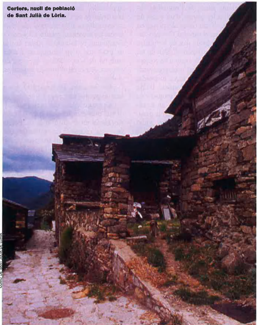
Certers, nucli de població de Sant Julià de Lòria.