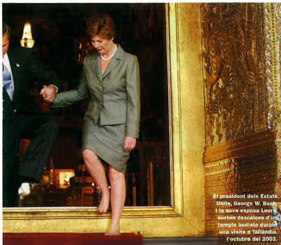
El president dels Estats Units, George W. Bush, i la seva esposa Laura, surten descalços d'un temple budista durant una visita a Tàilandia, l'octubre del 2003.

No hi ha proves concloents que George Bush haja fet esperar ambaixadors mentre parlava amb el seu pastor, però atès el nombre de figures religioses que passen per la Casa Blanca sorprendria que això no hagués arribat a passar. I Bush ha evidenciat una relació amb la religió que segurament faria estremir Mencken, com ara dir que Jesucrist és el seu filòsof favorit.