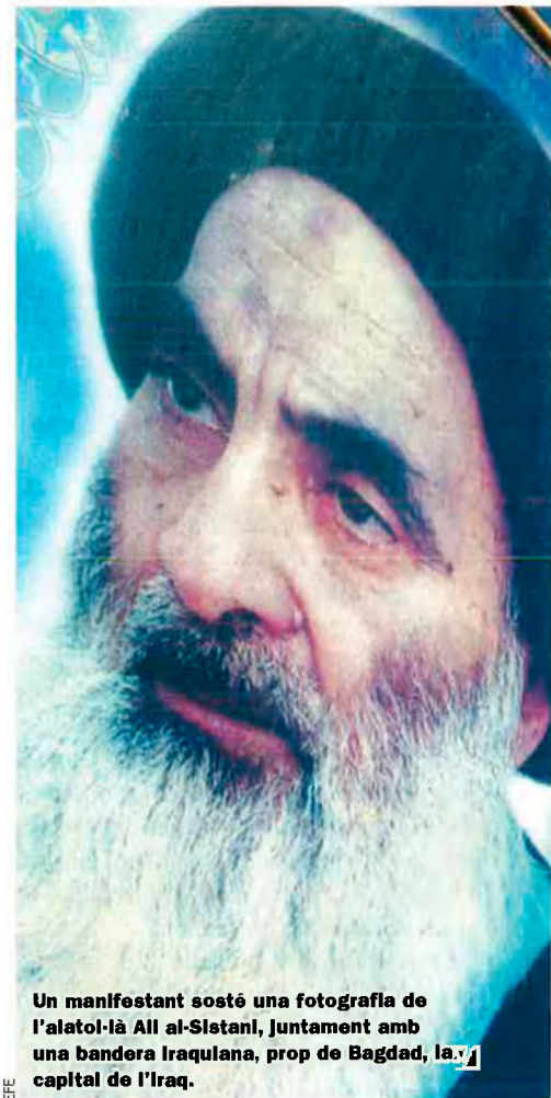
Un manifestant sosté una fotografia de l’al·tolià Ali al-Sistani, juntament amb una bandera iraquiana, prop de Bagdad, la capital de l’Iraq.

La resta d’aquest reportatge especial aborda les diverses maneres com la religió s’immisceix en la vida pública –des de partits d’orientació religiosa fins a intents de desafiar el capitalisme i la ciència. I comença amb el tema que més tem tothom: les guerres de religió.