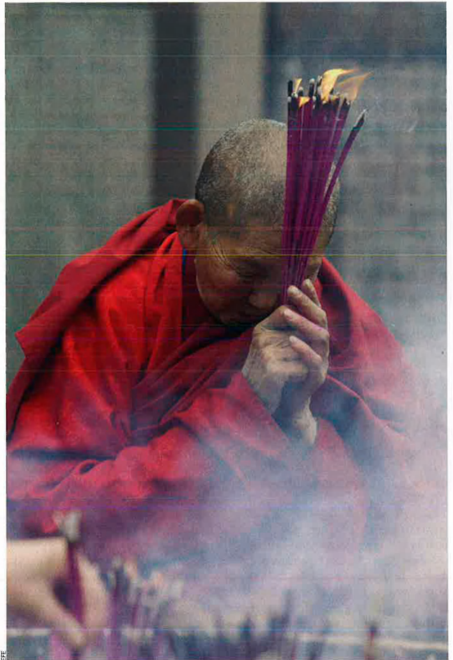
Un monjo budista fa una pregària abans de disposar encens en un altar del temple Wenshu, a Chengdu, la capital de la província de Sichuan, al sud-oest de la Xina.

A mesura que els metodistes esdevingueren més jeràrquics a mitjan segle XIX, començaren a perdre terreny davant els baptistes. Amb tota certesa, la destrucció creativa afectarà eventualment Yoido i també Warren. La religió als Estats Units tendeix a arribar a onades –i l'actual desvetllament podria estar esmoreint-se. Però un avantatge de la competició és que provoca respostes. Per exemple, el recent revés encaixat pel protestantisme coreà ha impulsat el catolicisme (en què els sacerdots no tenen fills que hereten esglésies). Els catòlics també contenen l'ofensiva dels pen-