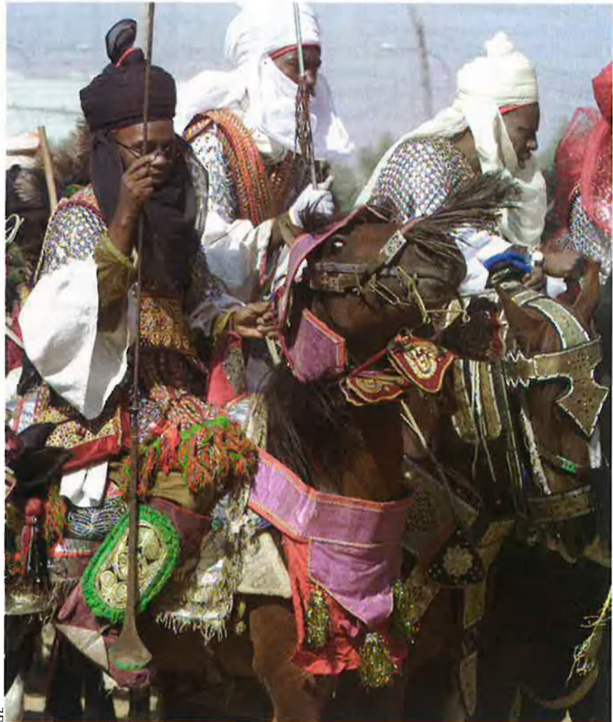
Els nobles cavallers nigerlans celebren el final del ramadà, en una festa en honor de l'emir de Kano, en aquesta ciutat de Nigèria.

Però per què sembla que el poder de la religió haja crescut? La primera raó és un seguit de reaccions i contrareaccions. El fonamentalisme islàmic, per exemple, ha ajudat a esperonar el judaisme i l'hinduisme radicals, que al seu torn han enfortit el fervor dels musulmans. Hamàs deu molt als colons d'Israel. Sense Falwell, ni Hitchens ni Dawkins no cobrarien tants drets d'autor.