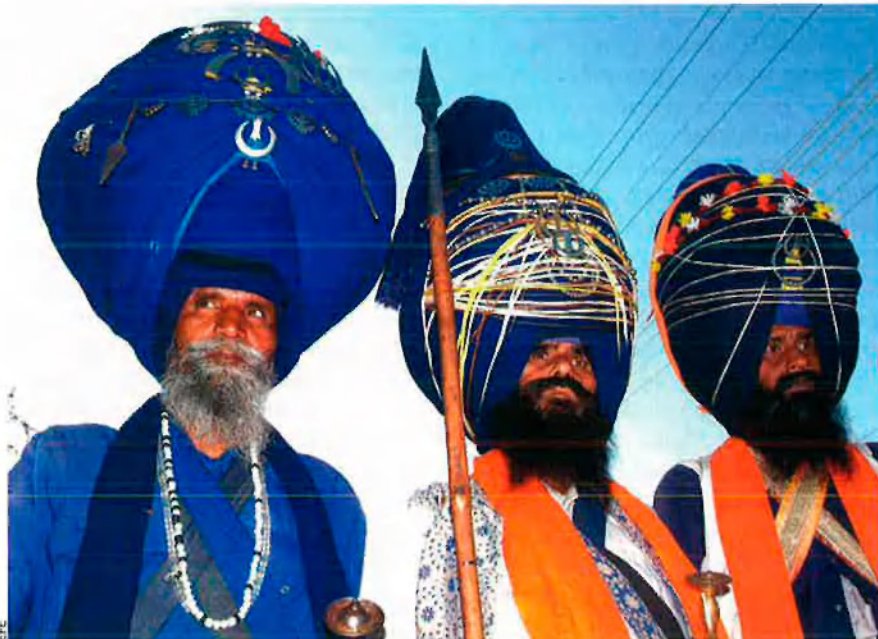
Tres membres de la comunitat sikh marxen durant una processó feta per celebrar el naixement del primer guru sikh, després de la mort del guru Nanak Dev Ji, el novembre passat.

s'ha propagat com la pólvora a les favelas del Brasil), però no tots. Els evangèlics americans tendeixen a ser ciutadans acomodats i amb educació. A l'Índia i a Turquia, els partits religiosos han crescut al caliu d'una burgesia creixent.