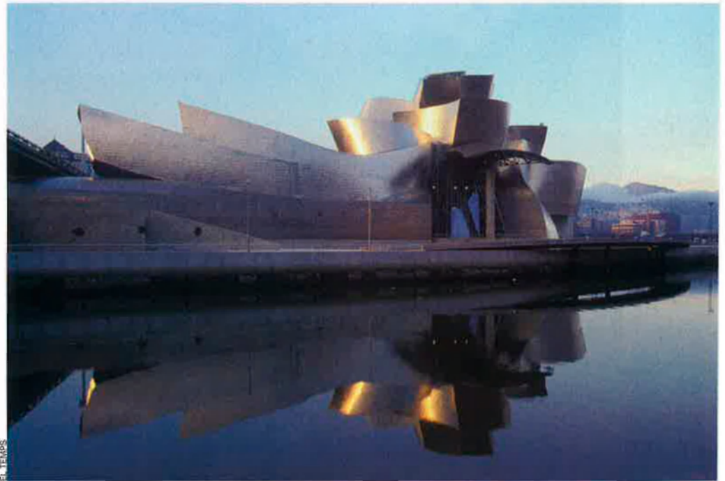
El Guggenheim Bilbao presenta, fins al 27 d'abril, una gegantina exposició, "Art in the USA: 300 años de Innovación".