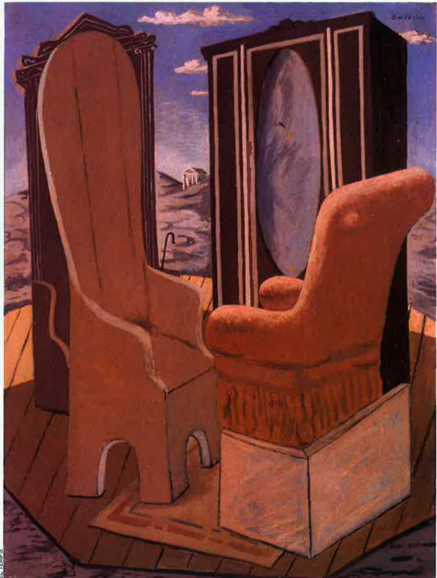
El mes de febrer, a l'IVAM, "El siglo de Giorgio de Chirico. Metafísica y arquitectura".

Espanya. El MNCARS de Madrid té oberta fins el 24 de març una interessant exposició titulada "La noche española", en la qual es revisa per primera vegada la posició del flamenc