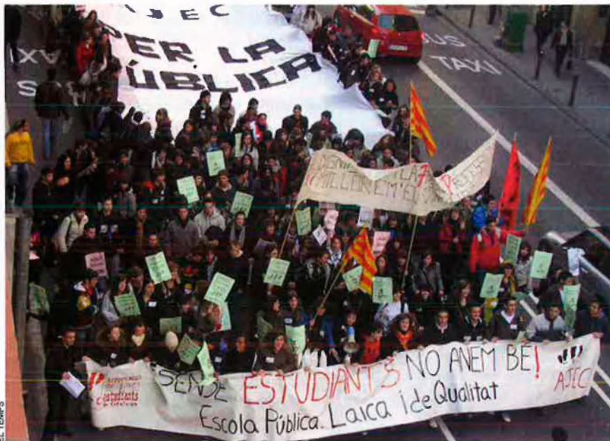
Uns 200 estudiants reclamen, a mitjan desembre, a Barcelona, ser escoltats en el procés de redacció de la llei d'educació de Catalunya.