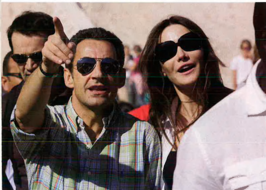
La relació del president francès amb la model italiana Carla Bruni ha omplert i omplirà moltes pàgines de la premsa al llarg del 2008.

Mitterrand, va veure en la Unió Europea el relleu d'una política que el país no tenia prou força per a dur a terme. Però aquesta utopia s'ha esbravat per diverses raons i Sarkozy arriba just després de dos mandats de l'ex-president Jacques Chirac que només han servit per anar ajornant el moment d'afrontar els problemes.