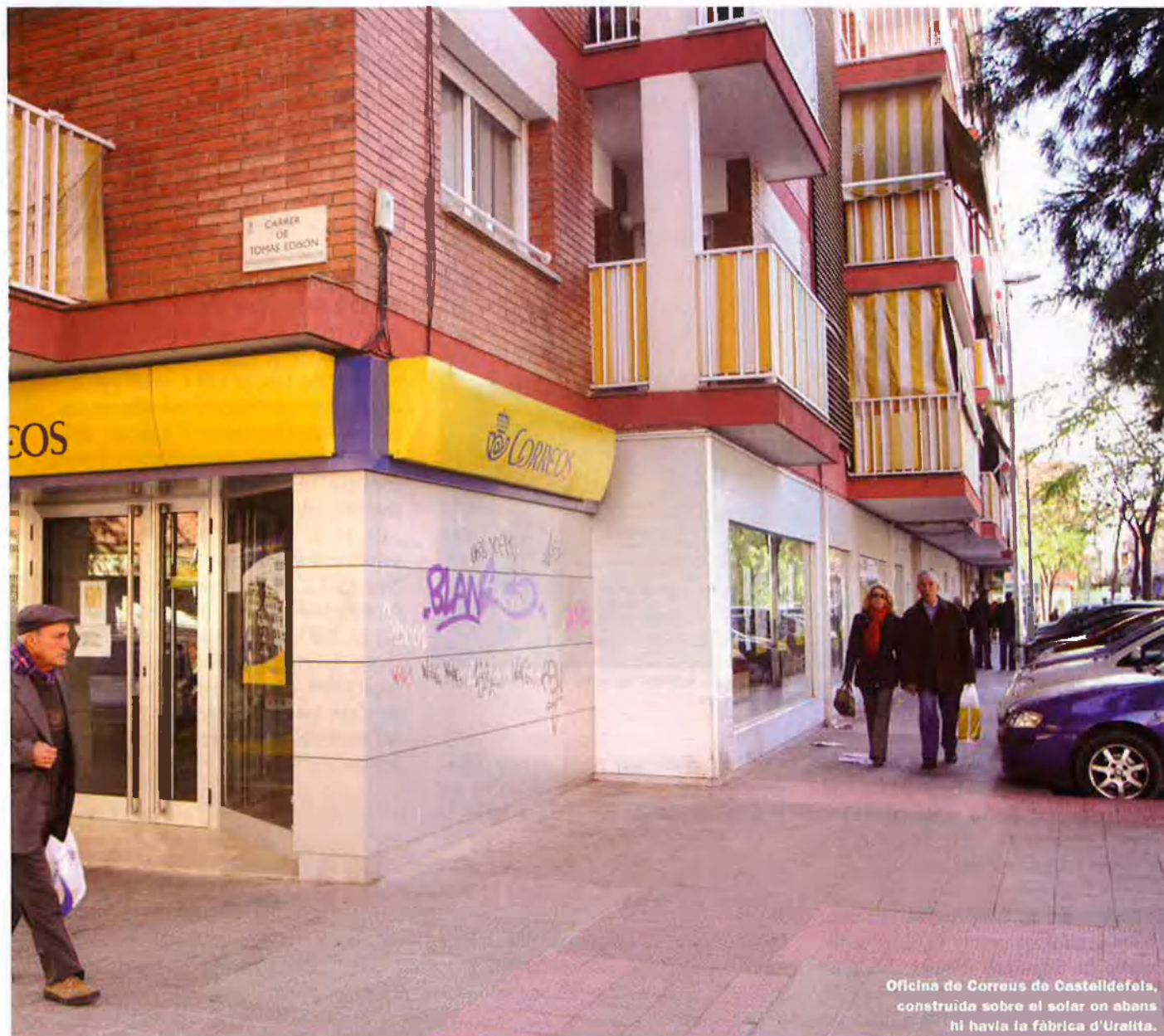
Oficina de Correus de Castelldefels, construïda sobre el solar on abans hi havia la fàbrica d'Uralita.

crear la plataforma, que ha començat amb una primera etapa d'assessorament per a escatir quanta gent hi ha afectada i fins a quin nivell.