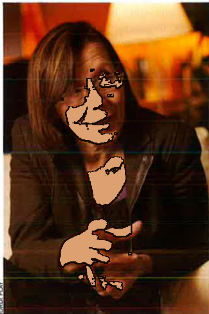
“La Plataforma pel Dret de Decidir mereix tot el meu respecte i admiració.”

—Sí que en té. Jo us faig una referència històrica. De tot allò que configura el socialisme espanyol avui, l'únic que té un procés —crec que és bo de recordar-ho sovint— de configuració diferent i d'estatuts com a partit independent i sobirà és el PSC. En el PSC conflueixen, en un moment determinat, la vella —i bella— reivindicació històrica de les llibertats nacionals i del reconeixement que volem per a la nostra singularitat com a poble, amb la consideració per —segons paraules de l'època— l'emancipació de la classe obrera i l'especial atenció a les classes populars. Aquests dos idearis són els que acaben configurant el Partit dels Socialistes de Catalunya, que neix de la unió de la federació catalana del PSOE i més moviments que s'havien anat agrupant al voltant del PSC. Sempre hem tingut estatuts propis, sempre hem tingut els nostres congressos, en els quals hem aprovat resolucions —que poden ser més encertades o no tant, però que són les nostres—; quan hi ha hagut eleccions d'àmbit estatal, sempre hem tingut programa propi; i el nostre projecte continua reclamant amb normalitat el reconeixement de la nostra singularitat com a poble. No és només votar diferent del PSOE. Això ho podem fer ara. Només caldria dir als diputats que no votessin. Es tracta de dir que el PSC no és el PSOE. El PSC és un partit independent, federat amb el PSOE, amb el qual té un