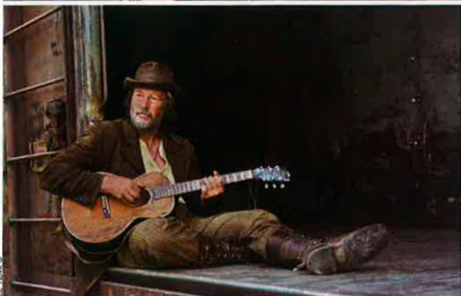
A dalt, fotograma del documental No direction home , de Martin Scorsese. A baix, Richard Gere interpretant Bob Dylan al film I'm not there . A la dreta, Cate Blanchet, interpretant un Dylan més jove, a la mateixa pel·lícula.

pròpia del pedestal d'heroi de la cançó protesta, que es mostra a parts iguals incorrecte i seductor, irritable i divertit, cosa que desconcerta una premsa que n'esperava respostes solemnes a tots els mals del segle XX. Dylan és al cim de la seua carrera: en quatre anys ha enregistrat set àlbums, l'epifànic The Times They Are A-Changin' , Bringing it all back home i la irrupció del folk elèctric, Highway 61 Revisited i Blonde on blonde , que acabaran formant les joies de la corona dylaniana. Dylan és l'artista de moda, figura mediàtica, el dandy poeta, el príncep del folk-blues, l'exemplificació modèlica del cantant protesta o la màxima figura de la contracultura internacional, segons els gustos i els bàndols. Massa etiquetes per a un cantant que ha decidit de fer de la música l'únic objectiu i l'únic compromís. Aquesta cruïlla musical o metamorfosi artística també surt projectada al documental Other Side of the Mirror: Bob Dylan Live at Newport Folk Festival , que recull les seues actuacions al festival entre els anys 1963