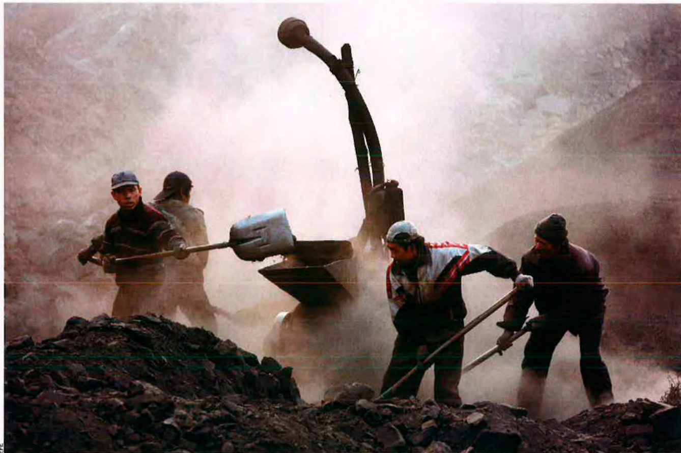
Les emissions de CO 2 del gegant xinès creixen a gran velocitat, sobretot per les centrals de carbó. A la imatge, una obrera treballant a la mina.